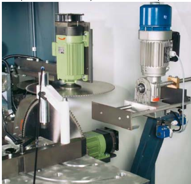
Réglage par CN 4 axes

Conçue pour l'utilisation de fraise-scie à pastilles de carbure Ø 500 mm (tête horizontale) et Ø 600 mm (tête verticale).