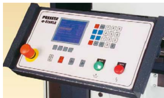
Pupitre à CN 4 axes